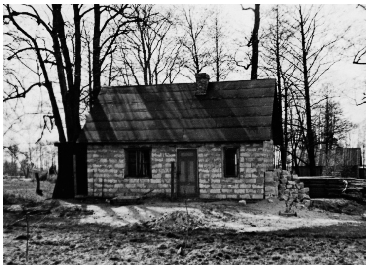
Pagaidu mājiņa 1946. g.

vēdera mētādami, viņi iznēsāja Solitūdes valsts pilsoņiem jaunākās ziņas.