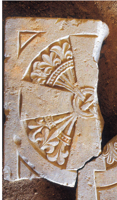
Kapu plāksnes daļa Peides Mārijas baznīcā Sāmsalā. Kataru krusts apla vidū atrodams arī Koeru Marijas Magdalēnas baznīcas gleznā. Koeru baznīca ir celta 13. gadsimta trešajā ceturksnī.

1200. gadā neatkarīgajai īru baznīcai bija pienācis gals (īru baznīca tika pakļauta Romai). 1204. gadā krustneši izpostīja kristīgo Konstantinopoli. 1206. gadā Dānijas karalis devās kara gājienā uz Sāmsalu, jāteic – salīdzinoši neveiksmīgi. 1220. gadā Dublinas virsbīskaps pavēlēja nodzēst svētās dievietes Brigitas mūžīgo uguni Kildarē, un pēc dažiem gadiem notika pirmais mēģinājums Sāmsalā noslīcināt faraonu (Latviešu Indriķis raksta, ka tas tika izdarīts 1227. gadā). Tātad – 1222. gadā dāņu karalis bija Sāmsalā, kur ieradās arī Rīgas bīskaps un ordeņa mestrs. Vienu vārdu sakot, pilns komplekts vietējo krustnešu. Nedrīkst aizmirst, ka faraons sevi uzskatīja par Saules dēlu, un Saules dēlu zināmā kontekstā var saistīt ar meteorītu.