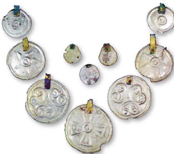
Kukruses skaistules kaklarota. Vecākas sievietes apbedīšana, apmēram 1200. gads. Zemāk vidū kataru krusts, pa kreisi un pa labi mātes dieves pentagrammas.

Kukruses daiļavas kaklarota. Igaunijas bagātīgajā kapakmeņu klāstā ir atrasts arī apaļš, no sudrabota skārda pagatavots kataru piekariņš ar templiešu krustu, kurš atrodas trīsrindu kaklarotas ārējās malas vidū. Uz viena kaklarotas piekariņu pāra ir attēlota pentagramma. Kaklarota liecina par pasūtījuma darbu, kuru veicis ne visai prasmīgs vietējais meistars. Tiek uzskatīts, ka pentagramma ir grūti izskaidrojama, jo Igaunijā tās atrodamas ļoti reti. Pentagramma bija viens no iecienītākajiem templiešu un kataru simboliem. Pentagramma ir mātes dieves simbols (salīdzinājumam – Veneras pentagramma). Pentagramma ir iemūžināta arī Karjas baznīcā Sāmsalā. Vai Kukruses daiļavas kaklarota kādā kontekstā norāda uz māti dievi? Līdzīgs saktas karulis ar kataru krustu ir atrasts arī Keilas tuvumā Ziemeļigaunijā pie liela akmens (Kumnas sudraba sakta, kas sastāvēja no 18 karuļiem dažādos variantos ar krusta motīviem). Saktas karuļi Igaunijā datēti ar 13. gadsimta otro trešo gadu desmitu.