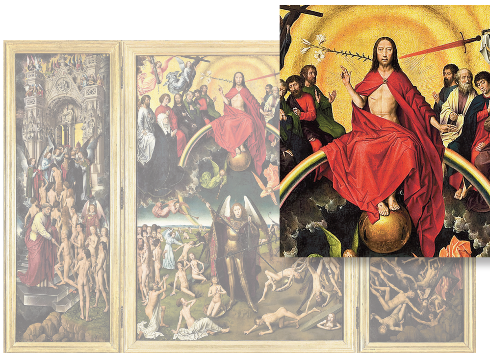
Hans Memlings. Pastarā tiesa (detaļas), apmēram 1470. gads. Zobens un lilija nāk no Taisnās tiesas spriedēja mutes. Tie ir Kristus raksturīgie atribūti. Dieva Vārds – tas ir zobena un lilijas spēks.

Dieva vārda zobens. Sebastians Minsters raksta ( Cosmographia , 1544. gads), ka lībieši vēl atrodas kristīgās pasaules malā un ka Anno Domini 1200 daži dievbijīgi un mācīti vīri devās uz turieni (uz Līvzemi), lai sludinātu kristietību un nodibinātu jaunu ordeni. Viņus sāka dēvēt par zobennesējiem, jo līdztekus Dieva vārda zobenam viņi izmantoja arī reālu zobenu, ar kā palīdzību centās ļaudis pievērst kristietībai. Tomēr viņi vieni paši tam bija pārāk vāji, tāpēc apvienojās ar Vācu ordeni Prūsijā, un tad tas viņiem izdevās.