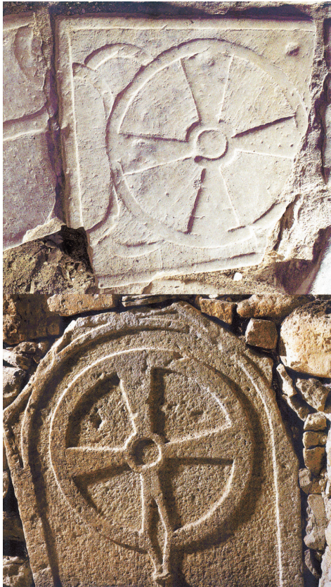
Ja nezina, kas ir kas, Rietumīgaunijas un Sāmsalas kapu plāksnes aplī attēlotos krustus ir viegli sajaukt ar kataru krustu apla vidū.