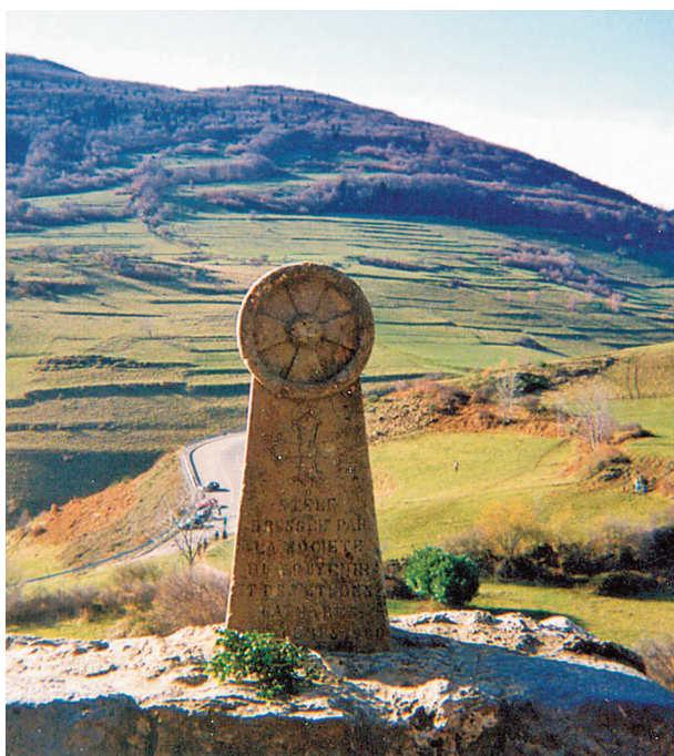
Kataru stēla, Langedoka

Īrijas iekarošana sākās 1171. gadā. Romas baznīca attaisnoja iebrukumu Īrijā kā kristīgās civilizācijas nešanu tikai vārda pēc kristiešiem, kuri īstenībā bija pagāni, – tas attiecās arī uz vietējiem senkristiešiem. Anglijas karalis Henrijs II 1171. vai 1172. gadā lēņoja Īrijas austrumdaļu. Tajā pašā laikā pāvests Aleksandrs III sāka krusta karu pret igauņiem: uz 1170., 1171. vai 1172. gada krusta kara bullas pamata sasauca dāņus, norvēģus, zviedrus un gotlandiešus uz bruņotu ticības gājienu pret igauņiem un citiem pagāniem ( Estonum et aliorum paganorum ). Citi pagāni – lībieši, latviešu senči, kurši...? Nezināma iemesla dēļ igauņi tiek izcelti starp citām pagānu tautām, līdzīgi izsakās arī hronists Indriķis.