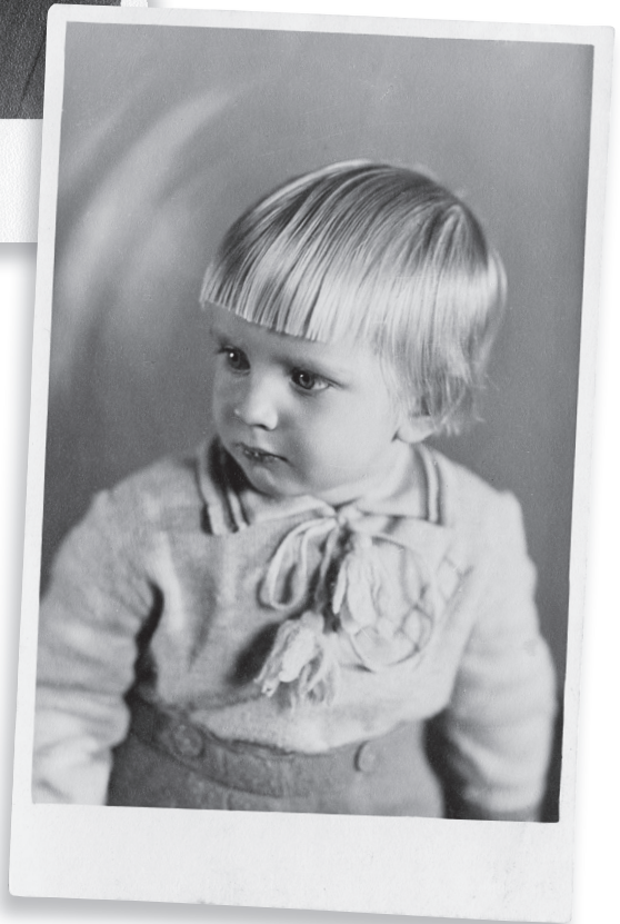
Ints Cālītis 1933. gadā